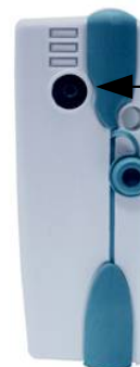
Connecteur type Jack 3.5 Entrée pour interface KISTOCK-PC